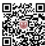
ดาวน์โหลด