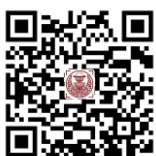
ดาวน์โหลดเอกสารประกอบ