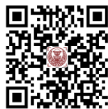
ดาวน์โหลดเอกสารประกอบ